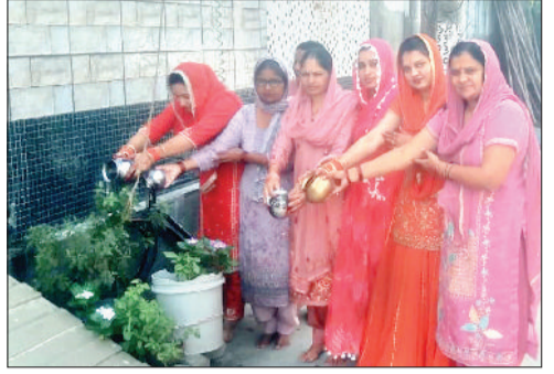
रोहतक। चौथ माता की कथा सुनने के बाद तुलसी महारानी की अर्घ्य देती सुहागिनें।

करवा चौथ के अवसर पर बाजारों और सैलूनों में विशेष आकर्षण देखा गया। मेहंदी और श्रृंगार के स्टॉल्स पर लंबी कतारें लगीं। महिलाएं अपने हाथों और पैरों पर मेहंदी रचाकर पारंपरिक श्रृंगार कर रही थीं। सैलूनों में हैयर स्टाइलिंग, मेकअप और पारंपरिक श्रृंगार के लिए महिलाओं की भारी भीड़ देखी गई। स्थानीय दुकानदारों ने बताया कि इस अवसर पर बिक्री में उल्लेखनीय बढ़ोतरी हुई। लोग पारिवारिक और व्यक्तिगत खरीदारों के लिए बाजारों में समय बिताने देखे। सुरक्षा व्यवस्था और बाजार में भीड़ नियंत्रण की वजह से लोग सुरक्षित वातावरण में खरीदारी कर सके।