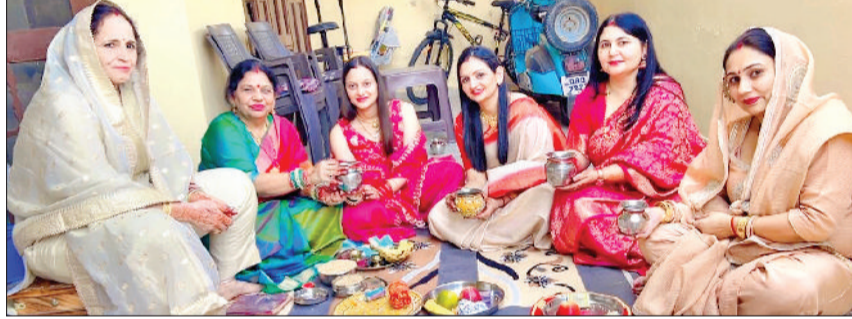
रोहतक। करवा चौथ पर्व पर सेक्टर एक में कथा में पूजा-अर्चना करती हुई सुहागिनें।