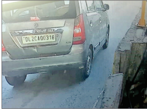
रोहतक। ओमेक्स सिटी में बच्चे के पीछे लगी कार।

छात्र ट्यूशन पढ़कर घर लौट रहा था कि अचानक दो लोग उसे अगवाकर कार डालकर ले गए। घटना के बाद इलाके में सनसनी फैल गई। पुलिस ने जांच शुरू कर दी और आरोपी पिता एवं बहन के खिलाफ केस दर्ज कर लिया है।