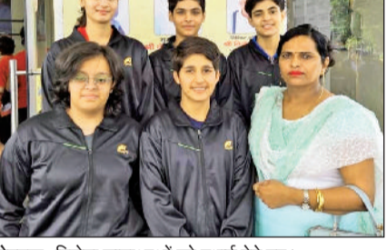
रोहतक। विजेता छात्राओं को बधाई देते हुए।