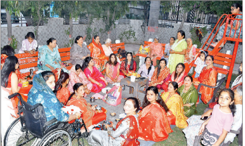
रोहतक। करवा चौथ पर्व पर झग कॉलोनी में कथा में पूजा-अर्चना करती हुई सुहागिनें।

शुक्रवार को करवा चौथ के अवसर पर सुहागिनों ने पारंपरिक रीति-रिवाजों के अनुसार निर्जला व्रत रखा और अपने पतियों की लंबी उम्र, स्वास्थ्य और खुशहाली की कामना की। सुबह से ही शहर में त्योहार का उत्साह देखने को मिला। महिलाएं नए वस्त्र पहनकर, हाथों में चूड़ियां और मेहंदी सजाकर पूरे दिन उल्लास और रौनक में रहीं। सुहागिनों ने दोपहर में चौथ माता की कथा सुनकर व्रत का धार्मिक महत्व समझा। इसके बाद रात्रि में चंद्रमा के दर्शन कर अर्घ्य देकर व्रत खोला। नवविवाहित महिलाओं में उत्साह का विशेष रूप से लोहा देखा गया। सुबह से ही महिलाएं अपने श्रृंगार और पोशाकों में सजी-धजी नजर आईं। जैसे ही शाम के समय चांद निकला, महिलाएं छतों पर जाकर उसे अर्घ्य देती दिखाई दीं। इस दौरान उन्होंने अपने पति की लंबी उम्र और परिवार की खुशहाली की कामना की। इस पर्व में श्रृंगार का विशेष महत्व है। सुहागिनों ने अपने श्रृंगार और सजावट के माध्यम से न केवल अपनी आस्था दिखाई, बल्कि त्योहार की खुशियों को भी दोगुना किया। कई महिलाएं पारंपरिक खेलों और सांस्कृतिक गतिविधियों में भी भाग लेने के लिए समूहों में जुटीं।