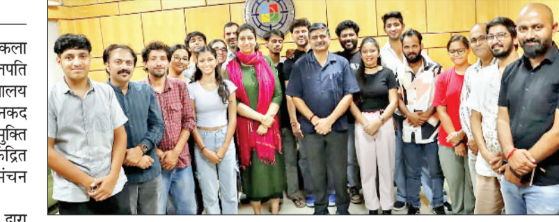
प्रतिबद्धता और सामुदायिक सेवा के लिए बढ़ाई दी