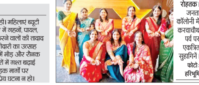
रोहतक। जनता कॉलोनी में करवाचौथ पर्व पर एकत्रित सुहागिनें।

करवा चौथ के महानगर मुख्य बाजारों में सुबह से ही खाली भीड़ रही। महिलाएं ब्यूटी पार्लर, सैलून और मेकअप स्टूडियो में कतारों में लगी रहीं। बाजार में गहनों, पारल, चूड़ियों, रंग-बिरंगे कपड़े और सजावट की सामग्री की खरीदारी करने वालों की ताबाद अधिक रही। दुकानदारों ने बताया कि करवा चौथ के मौके पर खरीदारी का उत्साह सामान्य दिनों की तुलना में तीन से चार गुना अधिक रहा। बाजारों में भीड़ और रौनक के बीच प्रशासन ने सुरक्षा के विशेष इंतजाम किए। पुलिस ने बाजारों में गश्त बढ़ाई और भीड़ नियंत्रण के लिए मार्गदर्शन किया। मुख्य बाजारों और सड़क मार्गों पर अतिरिक्त पुलिस बल तैनात किया गया ताकि किसी प्रकार की अप्रिय घटना न हो।